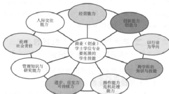
图2 墨尔本皇家理工大学商业（创业）学士学位专业致力于拓展的学生技能的教学内容

墨尔本皇家理工大学设置的商业（创业）学士学位是一个涉及创业以行动为导向的专业，该专业主要致力于拓展学生的知识、培养创业能力、增强信心以及帮助学生树立风险投资意识并获取驾驭企业运作的相关能力。该专业计划拓展的学生能力主要如图2所示。